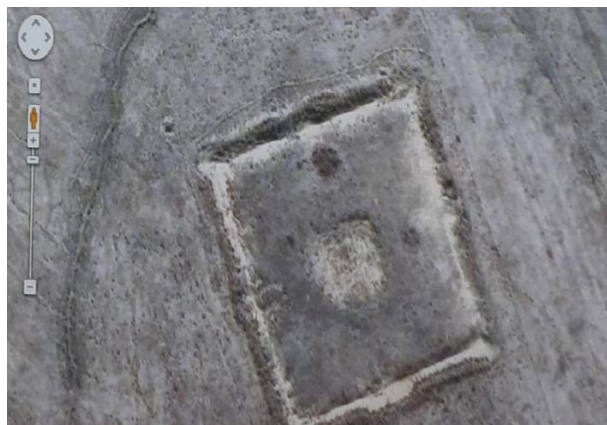
Сурет 2 – Әмірсана қамалының ғарыштан түсірілген суреті