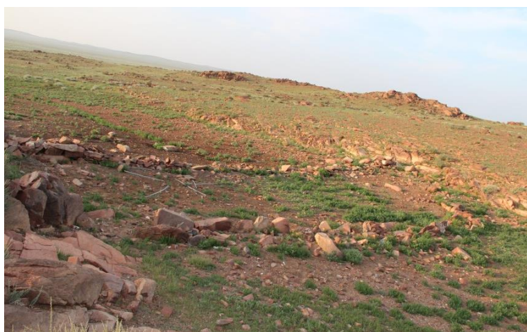
Сурет 3 – Жалпы көрініс. Моңғолия, УПС аймағы

Кетерде «Мүмкін, аталарыңның ошағы шығар» – деп әзілдеп маған берді. Сонымен қатар, Жарғалдың балалары ғимараттың түбінен шыққансадақ оқтары мен найзаның ұшын сыйлады. Мен бұл жәдігерлерді аса қуанышпен қабылдап, өзімнің бір әдемі бәкім бар еді, соны бердім. Мұны археологияда жер үсті материалдары (подъемный материалы) деп айтады. Құрылысты өлшеуге кірістік, ұзындығы – 20 м, ені – 3,70 м, қабырғаларының қалыңдығы туп-тура – 1м, қазіргі сақталған қабырғаларының қазіргі биіктігі – 0,5 м жуық (Сурет 3).