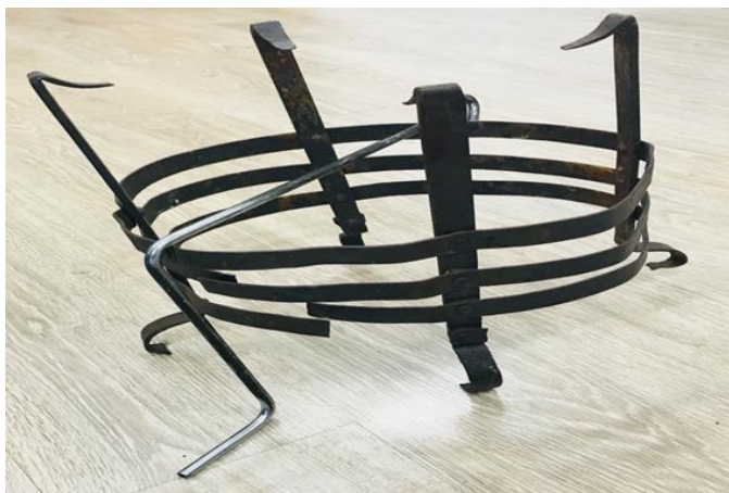
Сурет 8 – Ғимарат орнынан табылған моңғол ошағы

Сол шалдардың аты-жөнін білесің бе, дегенде ол күліп, былай деді: «Күн боран болатын, шалдар жолшылардың бекетіне келіп жылынып, тамақ ішті, ол кезде ештеңенін парқын білмеймін тек студент кезде қазақтармен араласқан соң, әңгімелеріне құлақ түргенім әлі есімде, партияның заманы ғой, естіген құлақта жазық жоқ, естігенің күнде бұйрық, сөгіс өзің білесің ғой командалық-әкімшілік жүйені» – деді. Мен әлгі кісіден Абылай ханның атын естігеніме қуанғаным сонша аты-жөнінде жазып алмаппын. Оның үстіне іздеп жүрген Ч.Дәлгәә келіп қалды, біраз әңгімелестік, ештеңе айта алмады, тек аймақтың тарихи ескерткіштерін зерттеп жүрген Улан-Батырда тұратын ғалымның аты-жөнін берді. Дегенмен, Абылай ханның Қытай қалың әскермен келіп, Әмірсананы бер дегенде, ол Ресейге кетті деп, бермеген деген сөзің Дәлгәәнің аузынан есту көңілімді көтеріп тастады. Ханның сонау Моңғолияда ізі қалған тарихи жерін табу жөнінде алғашқы қадам жасалды, сапарымыз сәтті болды деп ойлаймын. Ең бастысы, моңғолдардың тарихи санасында Абылай хан есімінің ұмытылмауының өзі феномен дер едім.