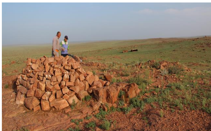
Сурет 5 – Нарынбұлық сумыны, Улаанузир (Қызылтүмсық) бағы. Біздіңше сумын аудан мағынасында, бақ колхоз мағынасында

Менің ойымша, екі құрылыста күзет мұнаралары (сторжевая башня) болған сияқты. Шығыс жақтағы құрылыстың жанынан кішігірім төртбұрышты бөлменің орны байқалады, дәл жанында өңделген орындыққа ұқсас тас тұр. Маңайды машинамен аралап бірталай жүрген соң, 100 км астам қашықтықтағы Упс қаласына келдік (Сурет 5).