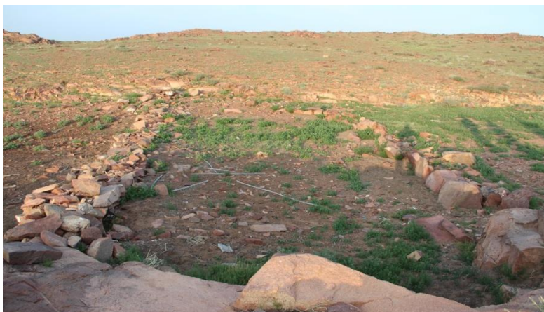
Сурет 1 – Биіктіктің үстіндегі оба