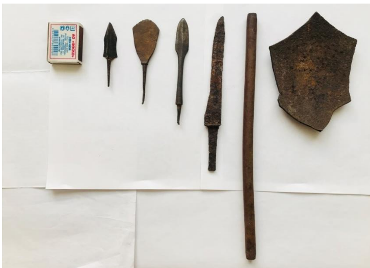
Сурет 7 – Ғимарат орнынан табылған садақ жебелері, найзаның ұшы, пышақ және қазанның сынығы