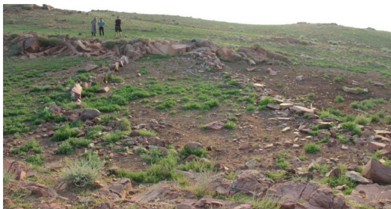
Сурет 2 – Құрылыстың қабырғасы

Кетерде «Мүмкін, аталарыңның ошағы шығар» – деп әзілдеп маған берді. Сонымен қатар, Жарғалдың балалары ғимараттың түбінен шыққансадақ оқтары мен найзаның ұшын сыйлады. Мен бұл жәдігерлерді аса қуанышпен қабылдап, өзімнің бір әдемі бәкім бар еді, соны бердім. Мұны археологияда жер үсті материалдары (подъемный материалы) деп айтады. Құрылысты өлшеуге кірістік, ұзындығы – 20 м, ені – 3,70 м, қабырғаларының қалыңдығы туп-тура – 1м, қазіргі сақталған қабырғаларының қазіргі биіктігі – 0,5 м жуық (Сурет 3).